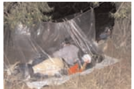
Durmiendo bajo la lluvia con el mínimo equipaje que se lleva en la ruta.

con un buen filete cocinado en un restaurante. Esta noche la pasaríamos en el parque municipal de la población de Valfarta en la que seríamos acogidos con una hospitalidad sin precedentes, tanto por parte de los pocos habitantes de esta población como de las propias autoridades de su ayuntamiento.