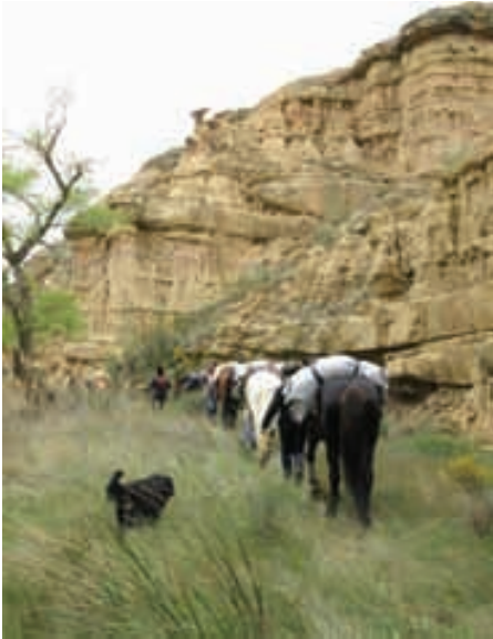
Pasando entre el río Alcanadre y las Ripas de Ballobar -paredes verticales producto de la erosión y llenas de agujeros y cavidades que dan cobijo a multitud de animales principalmente aves y reptiles-

famoso Monasterio de Santa María Reina de Villanueva de Sigüenza habitado actualmente por las Hermanas de la Orden de Belén de Sigüenza.