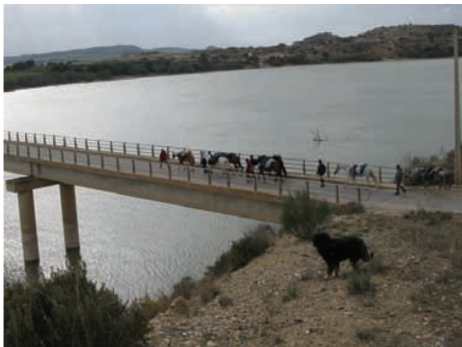
Pasando por encima de la cola del pantano de Mequinzena.

de la ECAE y que ahora, se ven en la obligación de demostrar, si estuvieran atentos o no, impulsados por el instinto básico de la supervivencia. Ya no sólo hacia su persona, sino que también hacia su caballo el cual tienen la obligación de devolverlo a la escuela en las mismas condiciones físicas con las que salió de ésta.