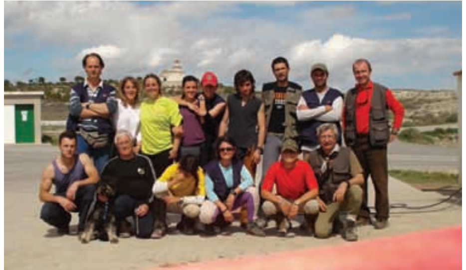
Foto de ambos grupos de alumnos con los monitores.