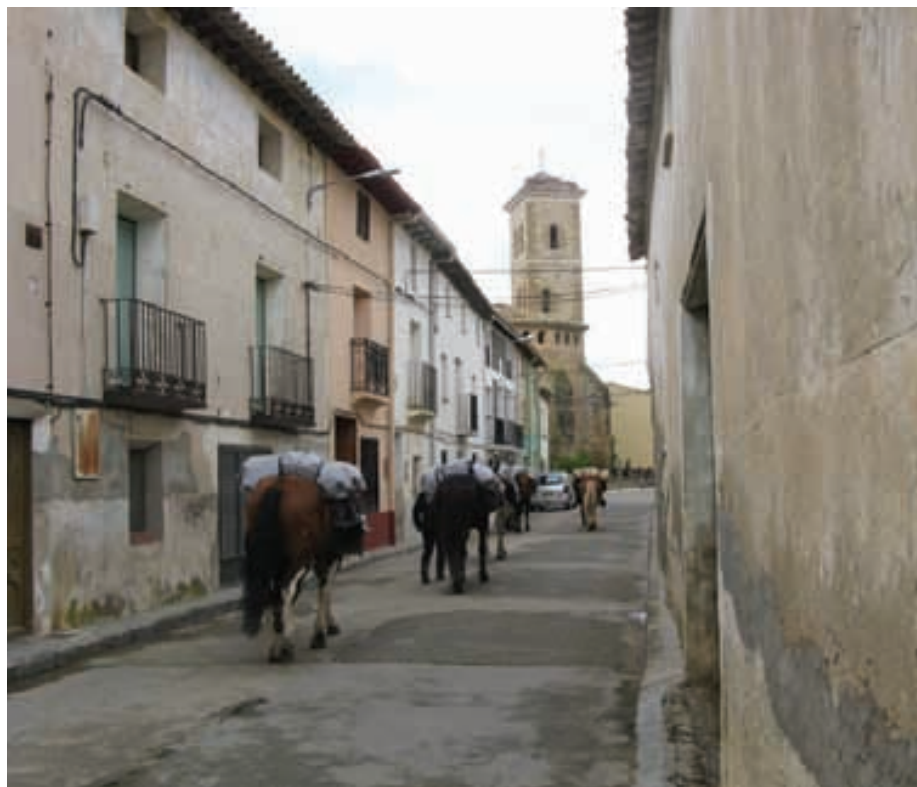
Calle General Franco en Sena.

Como ya hemos mencionado, se trata de una ruta organizada para los alumnos de guía ecuestre y con la que se pretende enseñarles a sobrevivir con lo poco que cabe alrededor de una silla de montar y sin ningún tipo de asistencia externa, ni para jinetes, ni para caballos. Ello la convierte en una ruta diferente y de las más pedagógicas para los alumnos, ya que durante estos días, tienen la oportunidad de poner en práctica todos los conocimientos adquiridos en las confortables aulas