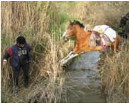
"Sultán" saltando uno de los torrentes.