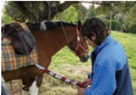
Un alumno improvisando una cincha con el poco material disponible.